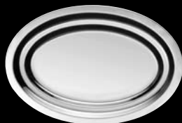
plat ovale oval dish