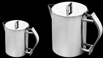
théière tea pot

182335 184606 182334 184604 182336 184607