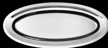
plat à poisson fish dish