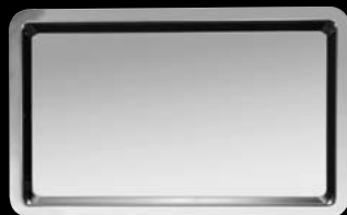
plateau rectangulaire sans anses rectangular serving tray without handles